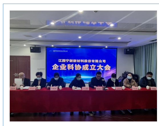
2022年12月，公司企业科学技术协会成立。