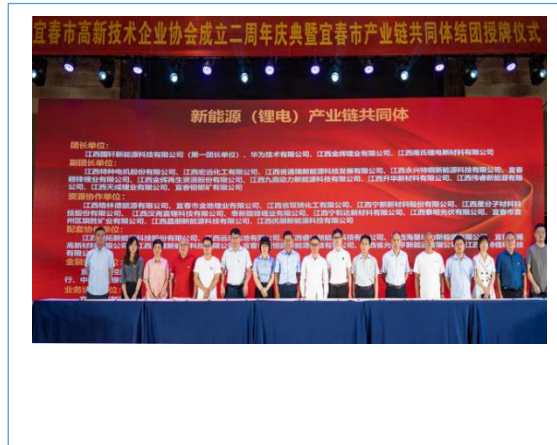
2022年6月，公司加入宜春市新能源（锂电）产业链共同体。