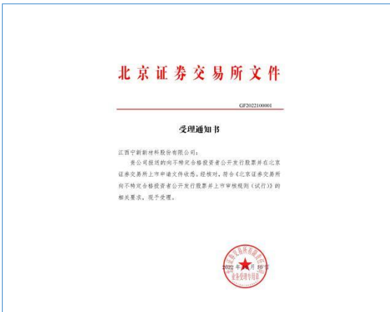
2022年10月，公司北交所上市材料获受理。