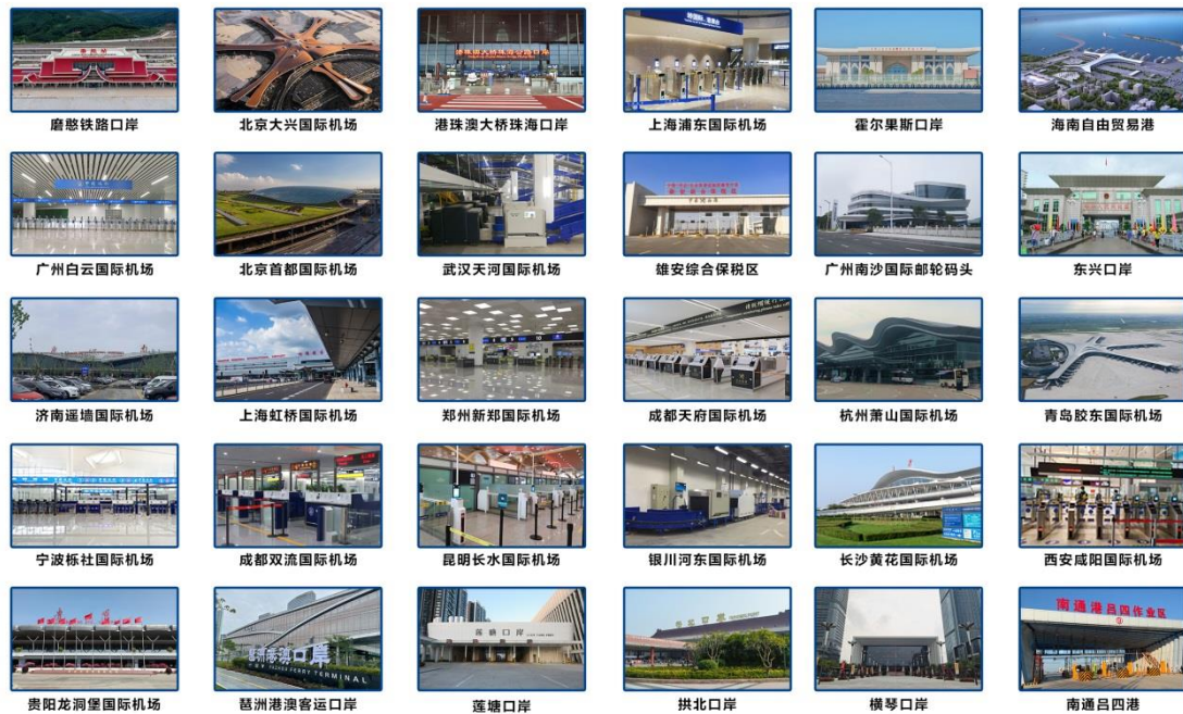
公司部分成功案例图

依托广东省智慧口岸工程技术研究中心、深圳市图像智能分析工程技术研究中心和博士后创新实践基地，基于设备互联、信息共享、集约管理等理念，通过图像分析、数据挖掘、机器学习等人工智能技术，开发满足业务需求的系统和产品，优化旅客、交通运输工具、货物、邮件查验流程，整合现有口岸系统资源，打通口岸各系统信息壁垒，实现口岸系统之间无缝连接，构建同一平台协作模式。公司研发并已落地应用的自助查验系统、海关智能旅检人脸识别系统、智能检疫系统、智能查验系统、口岸服务机器人、视频防尾随系统、集装箱空箱检测系统、车辆一站式电子验放系统、船舶人员智能管控系统、高分可视化指挥平台等系列产品，覆盖智能查验、智能防控、智能检疫等三个系列的智慧口岸查验防控系统，形成了在航空、陆路、水运三类口岸领域的全方位应用，为守护国门安全和便利化通关提供有力保障。