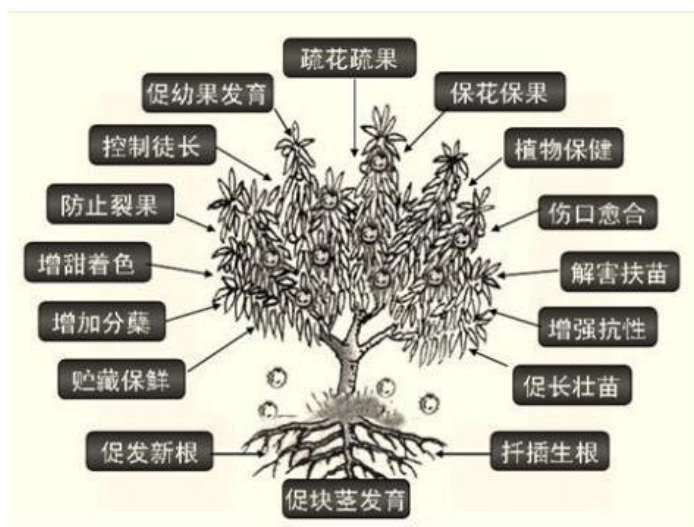
植物生长调节剂主要作用示意图

植物生长调节剂能够对作物的生长发育进程进行调控，并逐步形成一整套成熟有效的作物化控技术，这些技术成果在克服环境和遗传局限、改善品质和储藏条件等方面发挥了积极作用。因此世界各国都高度重视这一领域，植物生长调节剂的应用已成为农业科技水平的重要标志。到目前为止，有百余种植物生长调节剂在农业生产中得到了应用。国外农业在施用植物生长调节剂上的重点各不相同，如欧美等国为了适应机械化栽培和节省劳力，多注意矮化、脱叶、干燥剂的选用，日本则着力于提高农作物的产品质量。