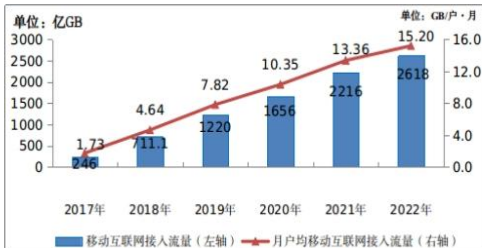
▲ 2017-2022 年移动互联网流量及月 DOU 增长情况

2022 年，移动互联网接入流量达 2618 亿 GB，比上年增长 18.1%。全年移动互联网月户均流量（DOU）达 15.2GB/户·月，比上年增长 13.8%；12 月当月 DOU 达 16.18GB/户，较上年底提高 1.46GB/户。