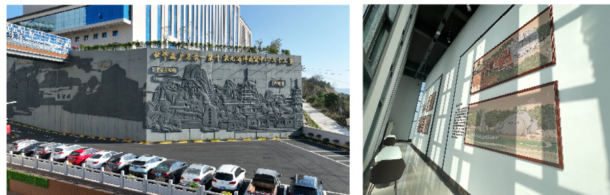
泉州项目：聚焦世界遗产，打造“工业旅游”新地标