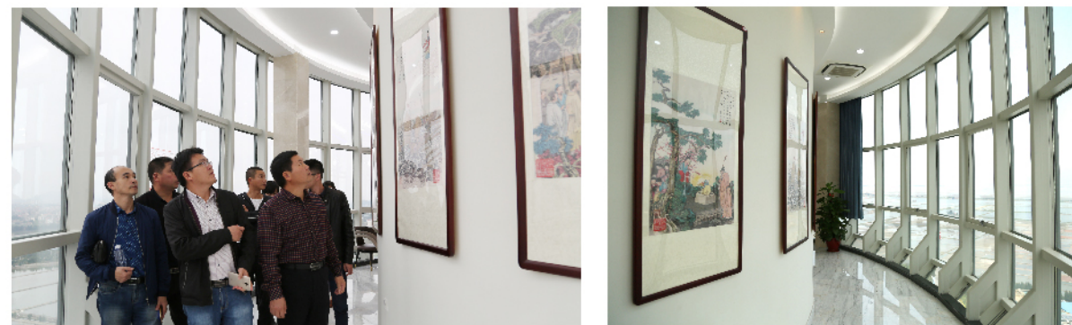
莆田项目：中国大陆首座92米层妈祖文化长廊

公司泉州圣元项目在项目建设时，结合“泉州：宋元中国的世界海洋商贸中心”被列入《世界遗产名录》这一重要历史时刻，坚持“历史传承、赏用相宜、绿色发展、空间均衡”的设计理念，打造了入口景观区、美岭湖景观、综合楼景观区、厂区墙面泉州世遗 22 景、长廊景观带、宗教文化长廊等多个区域，同时融合运用石雕、挂画、交互式智能应用场景等形式，形成了助力城市发展的生态纽带、倡导环保宣教的科普基地、融汇城市文化的景观长廊，不仅饱含了传承、创新、和谐、发展的文化温度，也体现了“天人合一、地物和谐”的发展观。报告期内，泉州圣元项目取得“北极星杯·公众开放优秀电厂”的殊荣。