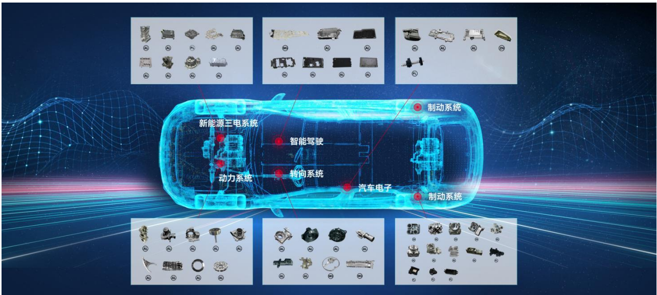
公司精密压铸产品在汽车的应用领域示意图