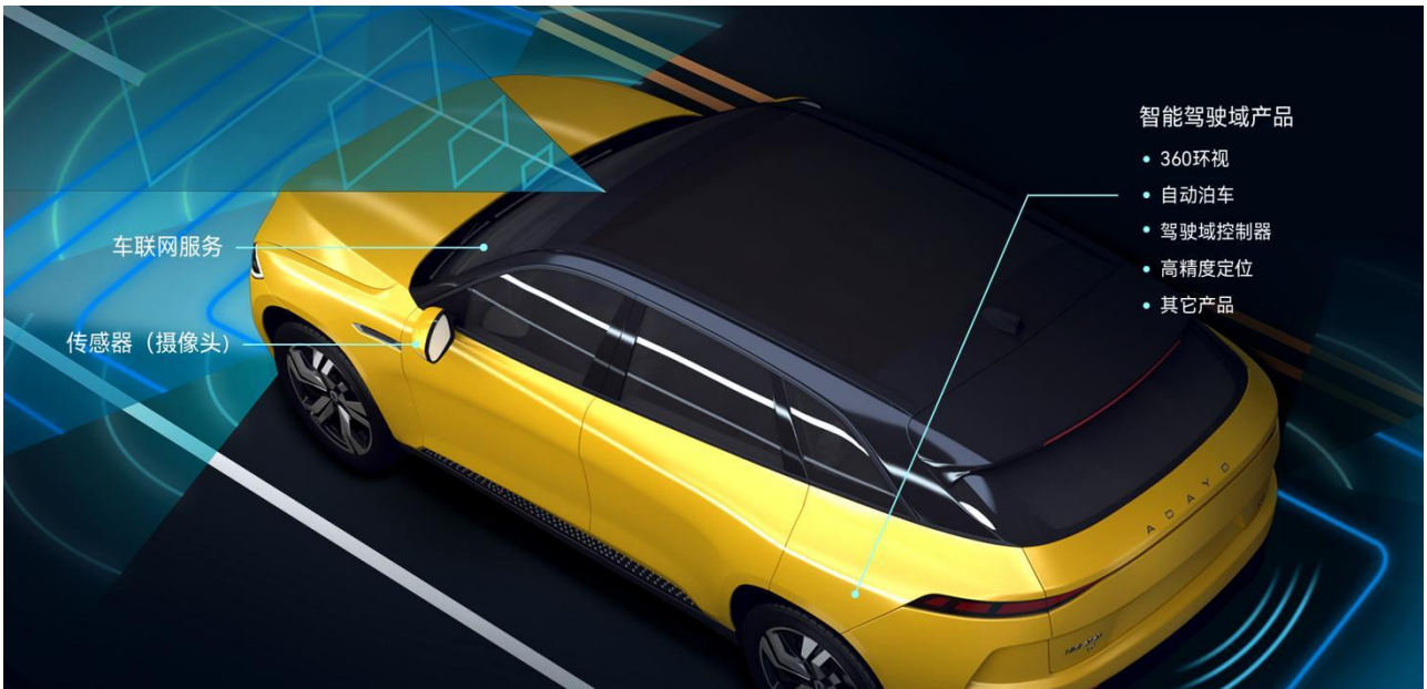
公司汽车电子智能驾驶及网联产品应用场景示意图