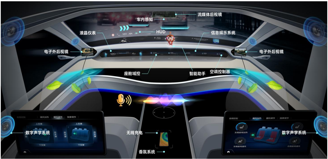
公司汽车电子智能座舱产品应用场景示意图