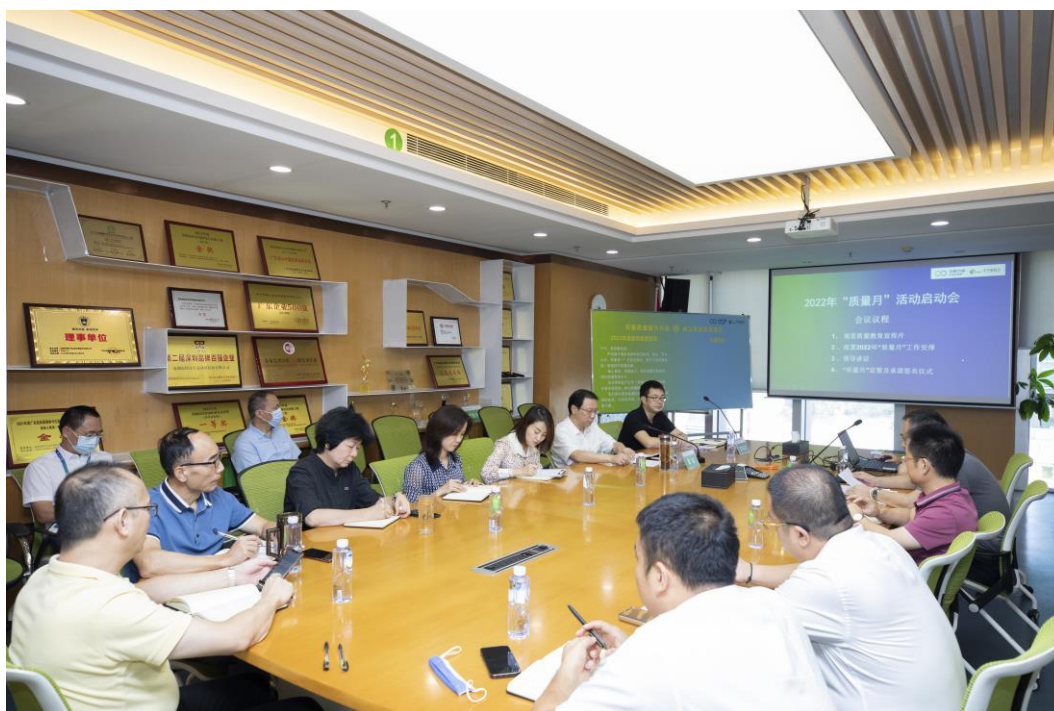
▲ 2022年“质量月”活动启动

公司始终坚持“安全生产、预防为主、综合治理”的安全生产方针，以国家安全生产法律法规、标准规范和职业健康安全管理体系为准绳，构建了完善的安全管理体系及制度文件，建立质量安全组织架构，加强子公司、区域质量安全管理，以项目巡检和目标责任考核为主要手段，坚守安全红线，将安全管理责任层层分解和落实，切实履行各级安全生产职责。同时结合公司自身实际情况，组织开展三级安全教育、安全技术交底、班前安全会、安全生产月、农民工业余学校、应急演练等活动，根据项目施工特点、施工复杂性和安全风险程度，对项目实行分级安全管理，确保了重大危险源的安全管理全覆盖；实行过程动态安全管理，定期和不定期开展安全检查，强化隐患排查治理工作，及时消除安全隐患，落实各项安全措施，确保公司安全生产形势的平稳。