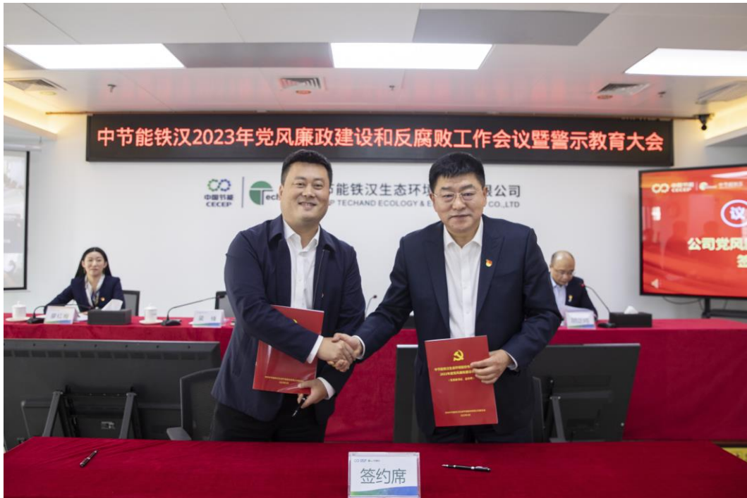
▲ 党风廉政建设和反腐败工作会议

转发《中国节能环保集团有限公司领导干部履职行为负面清单（两批）》，印发《公司规范公司党委管理领导人员配偶、子女及其配偶经商办企业行为实施办法》《公司领导干部插手干预重大事项进行记录的规定（试行）》2项制度。出台20条《经营管理工作禁令》，明确经营管理工作中的底线、红线和高压线。