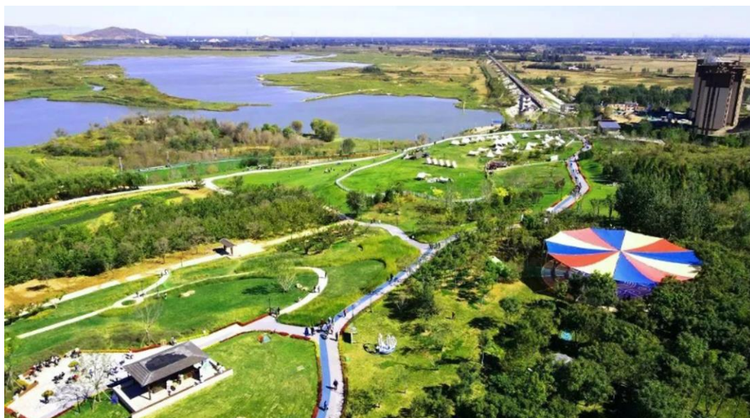
▲焕新后的瀑河水库休闲公园

科普于一体的旅游休闲圣地。修复后的瀑河水库地区，水清岸绿、鱼翔浅底，一派人水和谐相处的生态景象，已成为京津冀地区生态治理的重要标杆。瀑河水库生态环境整治，带来的不仅是生态效益，连片的项目建设和农场、帐篷营地等休闲景观的建设，也带动了当地经济社会的发展，实现了社会经济与生态效益的三效合一。