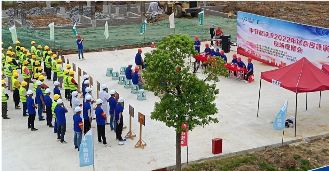
▲ 2022 年综合应急演练

2022 年，编制安全环保管理制度 3 个、修订 2 个，各经济实体根据自身实际编制修订安全环保管理制度共计 169 个，进一步提升了全系统安环管理工作的规范性。2022 年 4 月份，开展“职业病防治法宣传周活动”，共开展宣讲活动 57 次，宣传受众 2684 人次。2022 年 6 月，大力开展了“安全生产月”活动，先后举办了“安全生产月”活动启动仪式、主题签名、应急演练、组织全系统职工参加“新安法知多少”网络知识竞赛等活动。面向公司职工开展 2 次“安全生产大讲堂活动”；组织召开 3 次经济实体安环领导参加的安环工作月调度会，会上集中完成了安环管理工作要求的再学习、共性问题的剖析以及对策建议的再培训；组织传达学习集团公司下发的事故事件案例，以案为鉴提高全员风险意识、忧患意识；在公司内网“安全管理”模块分享 8 个安全培训课件，同时通过公司 OA 或微信群传达各经济实体学习；利用项目巡检时机，结合公司以往事故事件案例对项目进行安全培训 10 余次；2022 年 8 月、11 月，先后两次开展水利水电安全生产管理“三类人员”网络视频直播培训教育。2022 年，各经济实体及项目共开展各类安环培训 124 余次，共培训 10626 人次。2022 年，公司全系统未