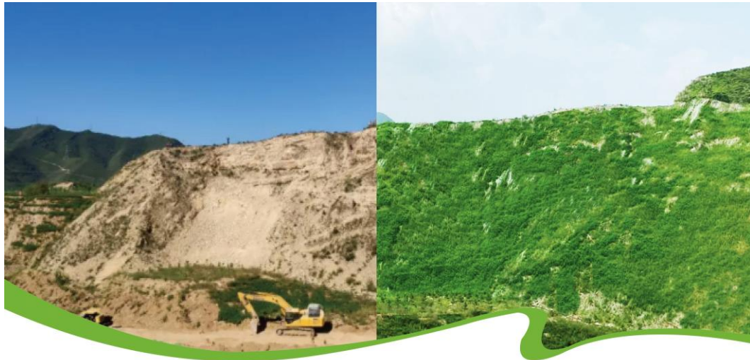
生态修复·山体边坡