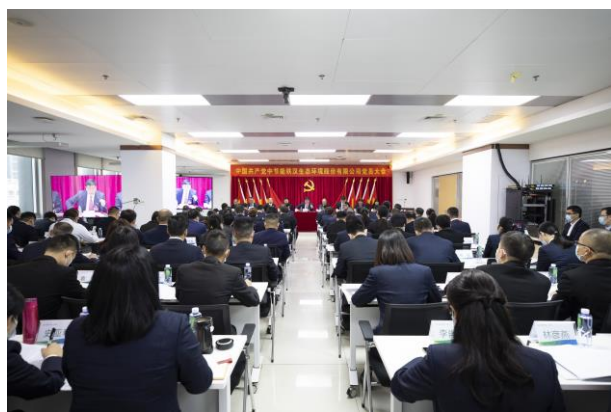
▲中节能铁汉党员大会

在全公司迅速兴起了学习宣传贯彻党的二十大精神的热潮。持续巩固深化拓展党史学习教育成果，组织开展荐读红色经典、党史学习教育知识竞赛、“第一议题”考学测评等活动，与属地党委开展“党群共融 共庆百年”系列主题活动，多措并举推动理论学习走深走实。公司广大党员干部职工坚定不移听党话、跟党走，工作信心、责任感和紧迫感明显增强。