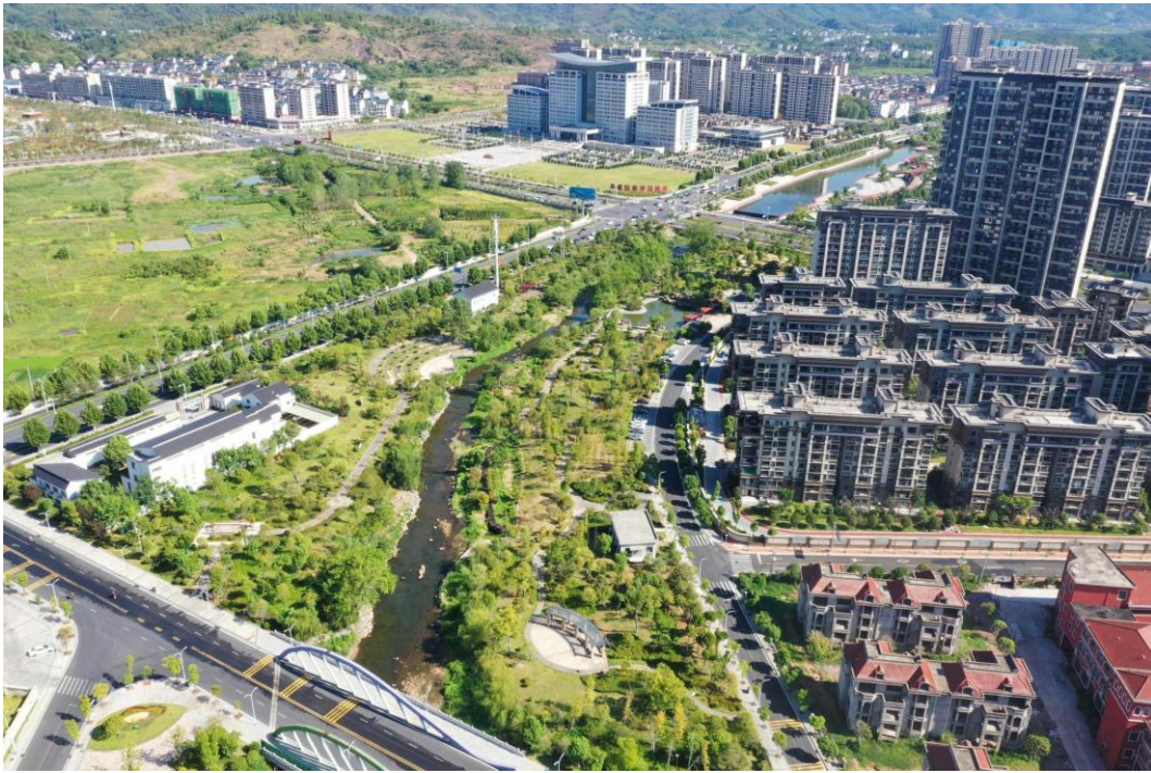
▲治理后的广丰区丰溪河流域西溪河段