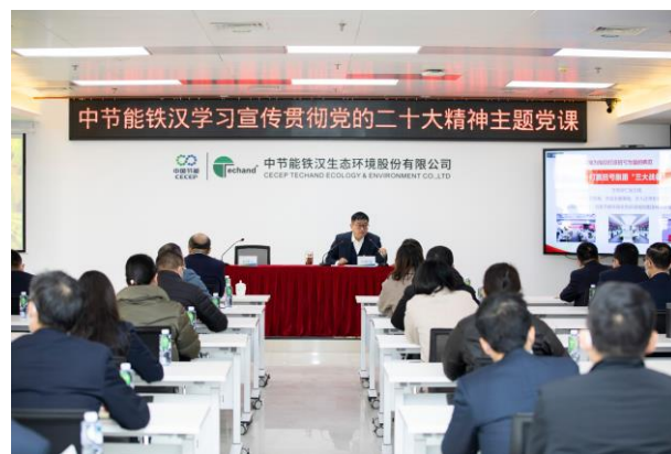
▲党的二十大精神宣讲