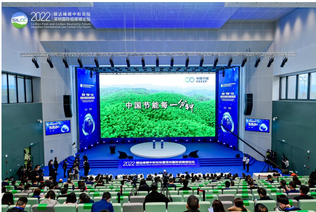
▲ 2022 碳达峰碳中和论坛暨第十届深圳国际低碳城论坛

公司主动配合、积极参与各级政府、监管部门以及行业协会的各项活动，为行业管理和可持续发展献计献策；关注大众媒体及社会舆论，虚心接受各方建议和意见，充分尊重所有关注公司发展的组织和个人，架起公司与公众沟通的桥梁，构筑和谐的公共关系。2022年度，公司在运营过程中，有意识、有计划地与社会公众进行信息双向交流及行为互动，以增进社会公众的理解、信任和支持，达到公司与社会协调发展的目的。