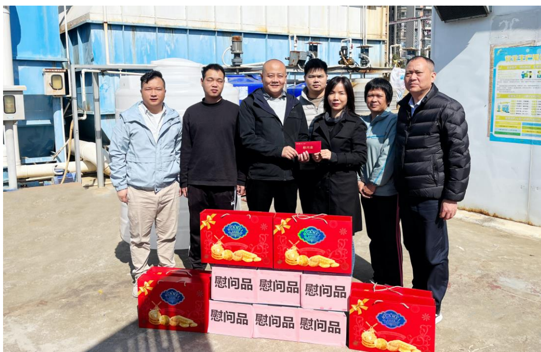
▲慰问集团公司“红旗班组”

公司积极开展“我为群众办实事”活动，着力解决职工群众的“急难愁盼”问题，不断促进管理和文化融合，为公司高质量发展凝聚强大合力。走访慰问各级职工百余人，开展冬送温暖、夏送清凉、金秋助学和助力消费帮扶等系列活动，为6名困难职工申请困难救助，积极向地方推荐公司职工申报深圳市五一劳动奖章，组织发动和参与“央企消费帮扶兴农周”活动。