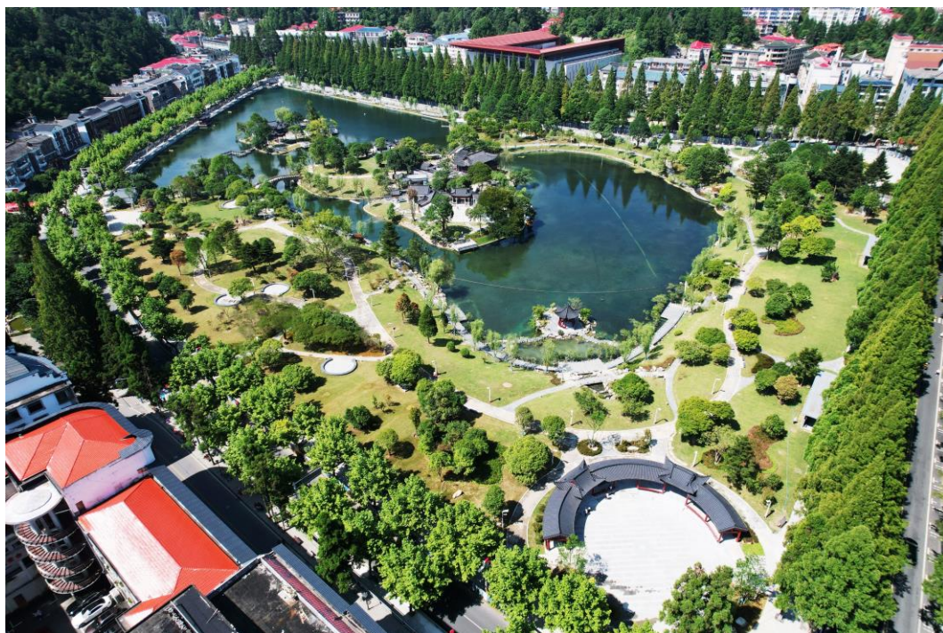
▲景观提升后的茨坪镇挹翠湖公园

打造江西省井冈山茨坪景区雨污水管网改造提升及挹翠湖水系治理工程EPC项目，铸就“红色文化+绿色生态”新名片。项目通过对茨坪镇的排水单元进行雨污分流改造，对现状排水管网缺陷进行修复，对河底管上岸改造，对现状污水提升泵站改造等工程措施，实现“茨坪镇雨污分流全覆盖、排水管网正常使用50年、污水厂COD进水浓度提高到132mg/L以上”的目标。通过对茨坪镇挹翠湖公园景观提升，形成山水相生、城景相渗、游客共享生态特色的核心绿色空间，推动红色景区与生态公园渗透融合，激发茨坪景区的潜力。打破现有“绿有余而美不足”的植物格局，营造四季皆有景可赏的精致山水画卷。