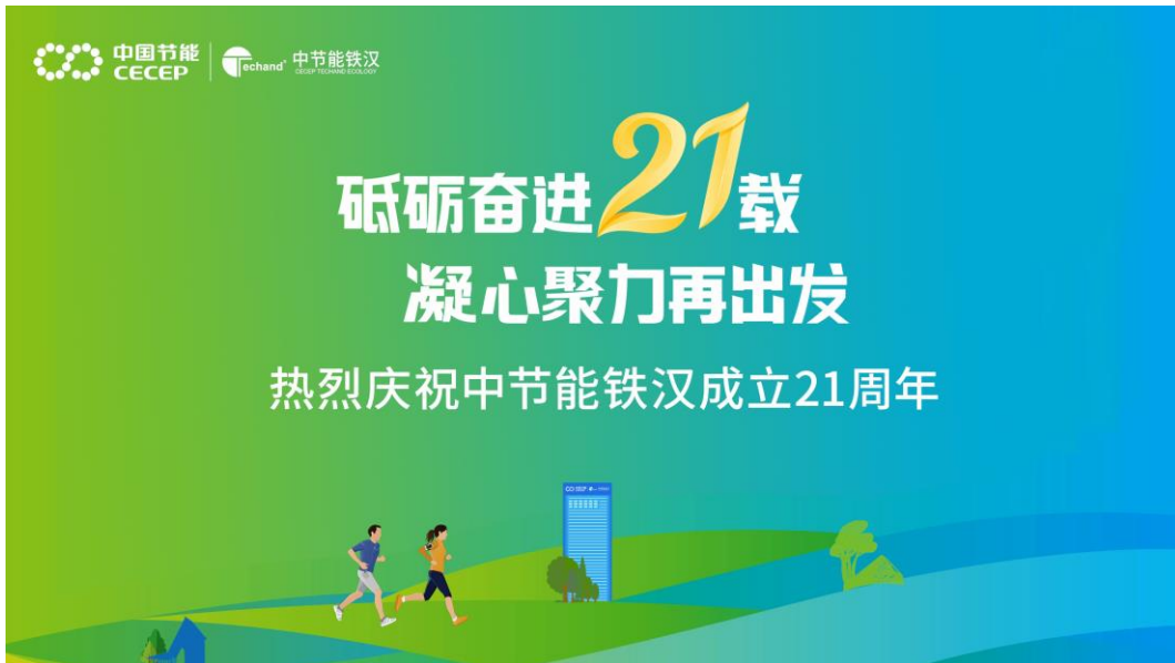
▲ 职工线上健步活动