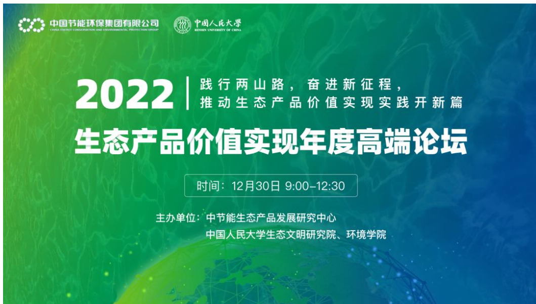
▲生态产品价值实现 2022 年高端论坛

我们受邀参加 2022 碳达峰碳中和论坛暨第十届深圳国际低碳城论坛，推介中国节能综合解决方案及“双碳”背景下的探索与实践，并获得多家媒体报道，品牌知名度与美誉度持续提升。