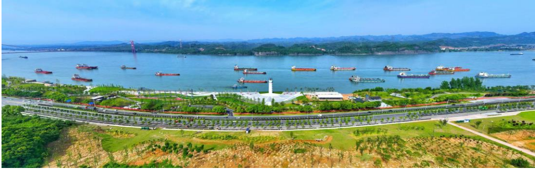
▲中节能铁汉匠心打造的湖北省宜昌市灯塔广场

太湖梅梁湖生态修复示范工程（三标段）檀溪村湖湾生态修复示范工程，为太湖治理贡献中节能铁汉方案。中节能铁汉坚持“科学治太”，因地制宜制定“突出减磷控氮、系统精准施策”的项目治理策略。根据檀溪村湖湾全年风向特点，采用以挡藻消浪为前提，野生杂鱼控制为手段，生态修复为根本的治理理念，逐步改善檀溪村湖湾生态环境，打造宜居型生态湖湾。项目不仅是在太湖开放水域构建草生态型清水环境的一次重要验证，而且在檀溪村湖湾打造出了一幅美丽的湖湾风景画卷，精准措施创出治理新成效，极大地提升了湖湾沿岸水体和景观效果，对太湖的生态修复具有重要示范意义。