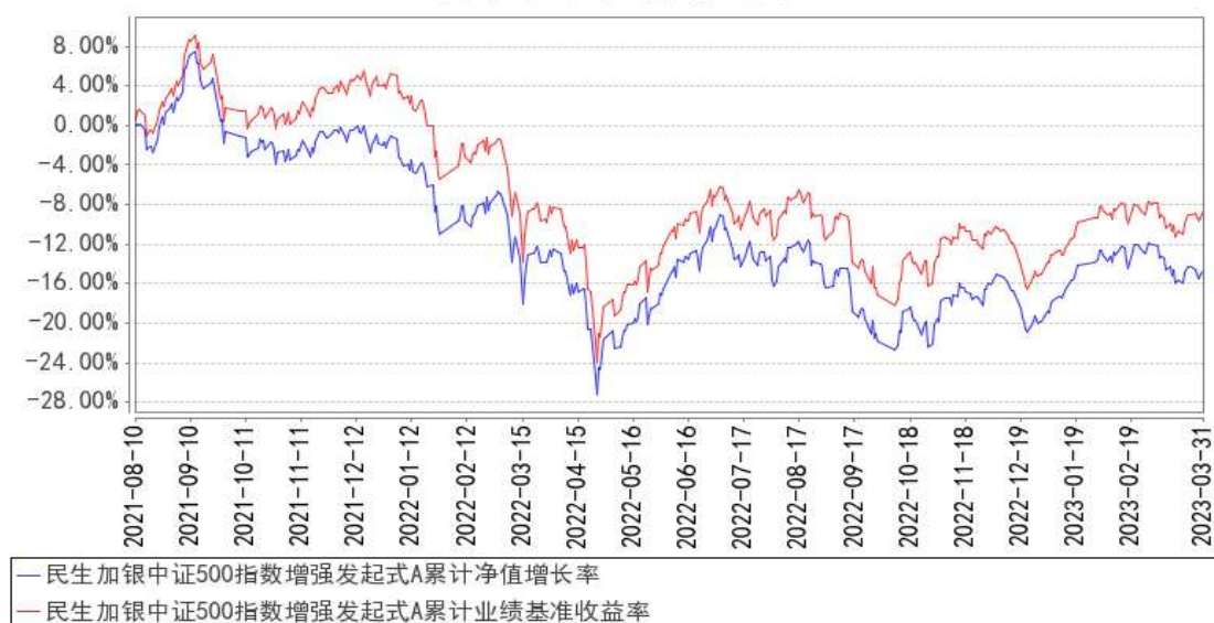
民生加银中证500指数增强发起式A 累计净值增长率与同期业绩比较基准收益率的历史走势对比图