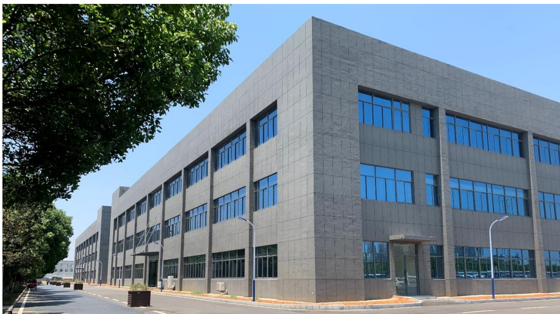
公司“年产10亿只超小型、高精度SMD石英晶体谐振器项目”生产厂房实景照片

报告期内，公司募投项目“年产10亿只超小型、高精度SMD石英晶体谐振器项目”生产厂房建设完工，部分生产设备开始安装调试工作，报告期末已建成部分产能；公司募投项目“研发中心建设项目”已完成研发中心大楼的规划与设计工作，并开始基建工作和采购部分研发设备。