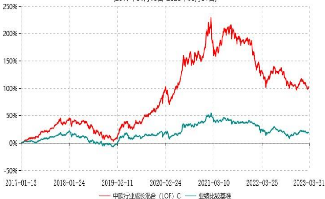
中欧行业成长混合 (LOF) C累计净值增长率与业绩比较基准收益率历史走势对比图 (2017年01月13日-2023年03月31日)

注：本基金自 2017 年 1 月 12 日起新增 C 类份额，图示日期为 2017 年 1 月 13 日至 2023 年 03 月 31 日。