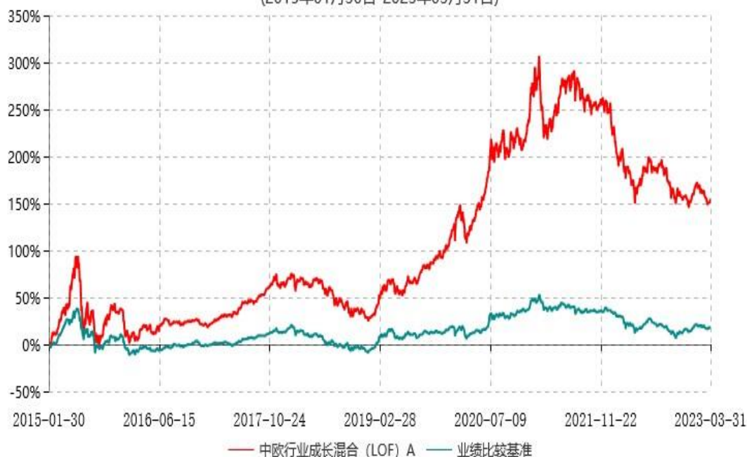
中欧行业成长混合 (LOF) A累计净值增长率与业绩比较基准收益率历史走势对比图 (2015年01月30日-2023年03月31日)