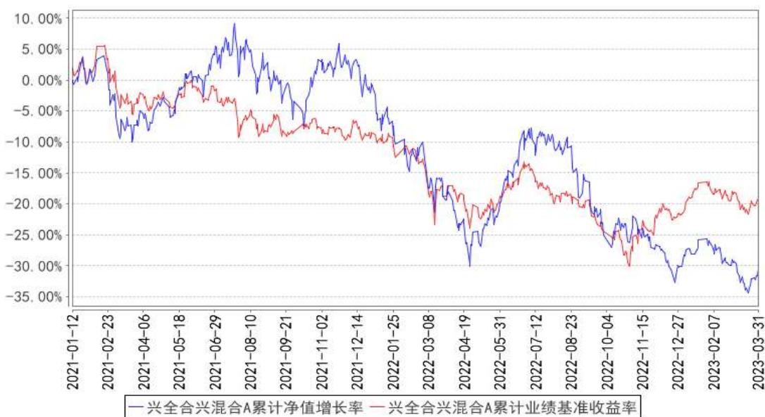
兴全合兴混合A累计净值增长率与同期业绩比较基准收益率的历史走势对比图