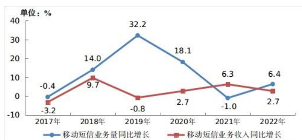
图2 2017—2022年移动短信业务量和收入增长情况

随着移动互联网技术进步，移动应用层出不穷，但短彩信作为运营商的基础业务，特别是已经形成用户使用习惯和成熟部署模式的现状下，短彩信作为企业最为便捷的用户信息互动工具，还将长期存在并且持续性发展。根据工业和信息化部网站公布的《2022年通信业统计公报》显示，经初步核算，2022年电信业务收入累计完成1.58万亿元，比上年增长8%。2022年，全国移动短信业务量比上年增长6.4%，移动短信业务收入比上年增长2.7%。