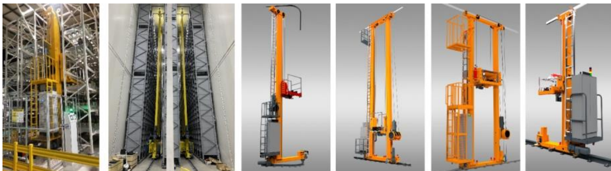
图 2：公司堆垛机系列产品

堆垛机是高架立体存取单元货物的专用起重设备，可在安全、高密度、高效率的存储结构中快速获取托盘、料箱和其他大宗货物，可提高仓库面积和空间利用率及仓储系统作业效率，实现自动化出入库，满足各种存储需求。公司现有自主研发堆垛机五大系列，可满足客户不同场景需求。