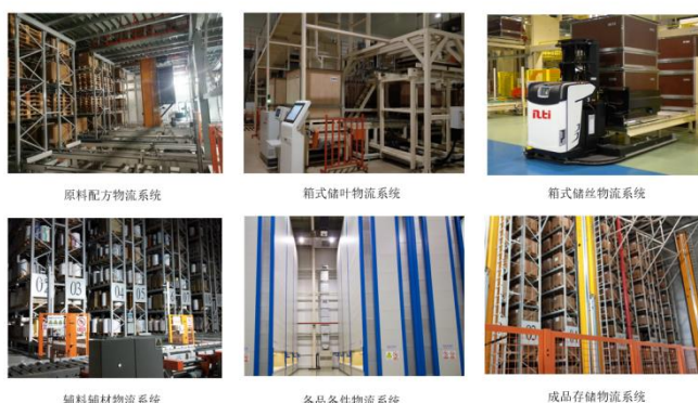
公司智慧物流和智能制造系统在烟草行业应用的实景图