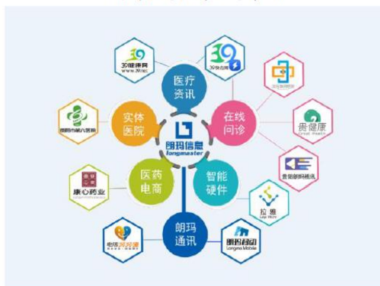
朗玛信息医疗生态系统

报告期内，公司围绕年初制定的经营目标，继续深耕“互联网+医疗”，推进线上互联网医疗服务+线下实体医院的医疗服务，电信及增值电信业务以创新业务发展、遵守行业监管为导向，各业务相互协作与协同发展，保持稳步增长，加速完善朗玛互联网医疗生态系统，提高综合竞争力。