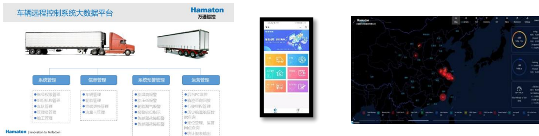
“智汇万通”车联网远程信息管理系统

为突破芯片的供应链限制，在 PPM 传感器的基础上开展技术迭代的研究，新开发的 NLP 传感器延续了 PPM 传感器的外形、重量和低功耗优势，信号更稳定，芯片适用性更广，已进入路试阶段。