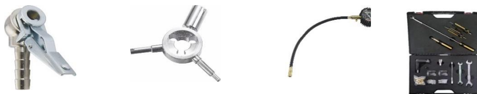
不同种类的轮胎用品