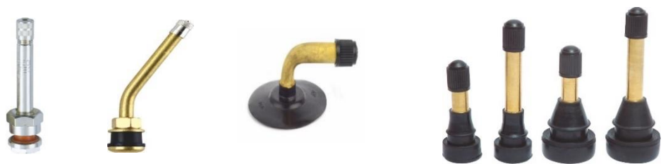
不同种类的轮胎气门嘴