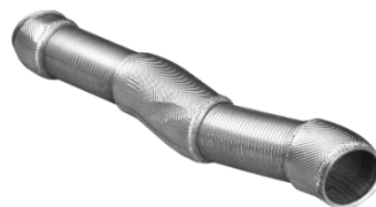
气密金属软管总成