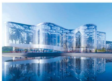
世博文化公园温室花园