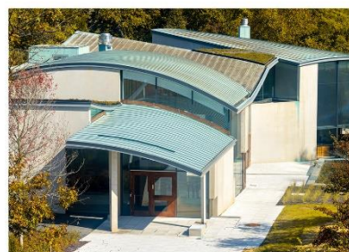
普林斯顿鲁宾斯坦公地高等研究所