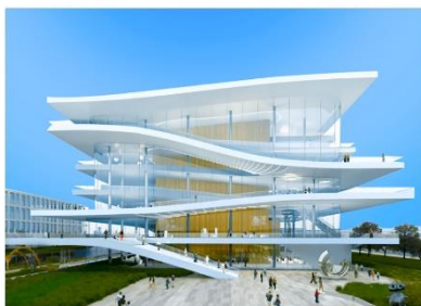
临港青少年活动中心