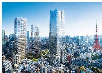
虎之门·麻布台地标塔