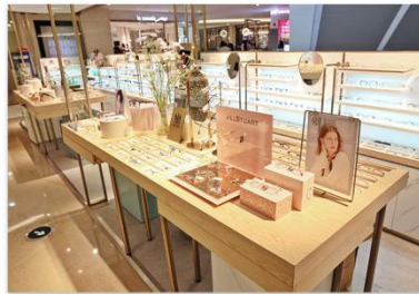
· 砵门店 ·