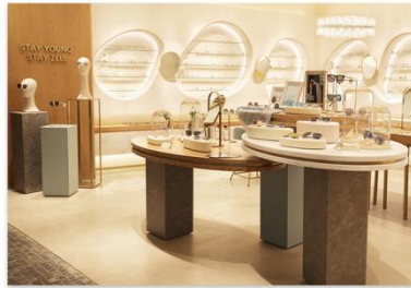
· ZELE门店 ·