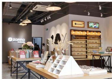
· ZORRO门店 ·