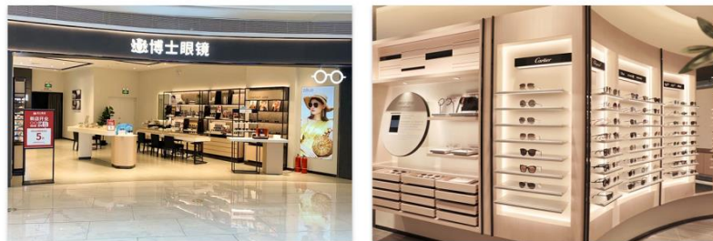
· 博士眼镜门店 ·