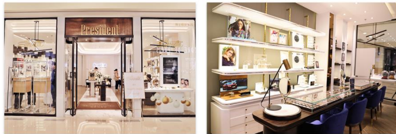
· President optical门店 ·