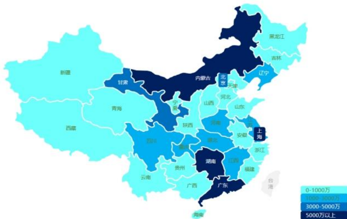
过去三年公司电力行业业绩分布