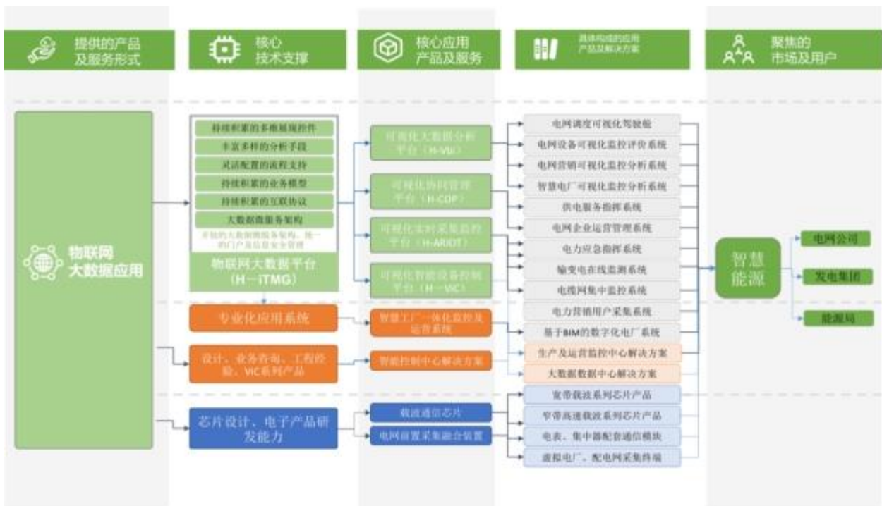
技术及产品战略图

技术及产品创新是公司可持续发展的根本。公司在确立以物联网大数据为战略发展方向的前提下，取公司已有技术研发成果之精华，通过创新、升级形成公司的面向物联网大数据核心技术平台是公司未来三到五年的主要研发战略目标。