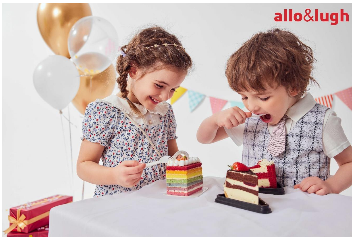
allo&lugh 阿路和如 重庆协信星光时代广场店