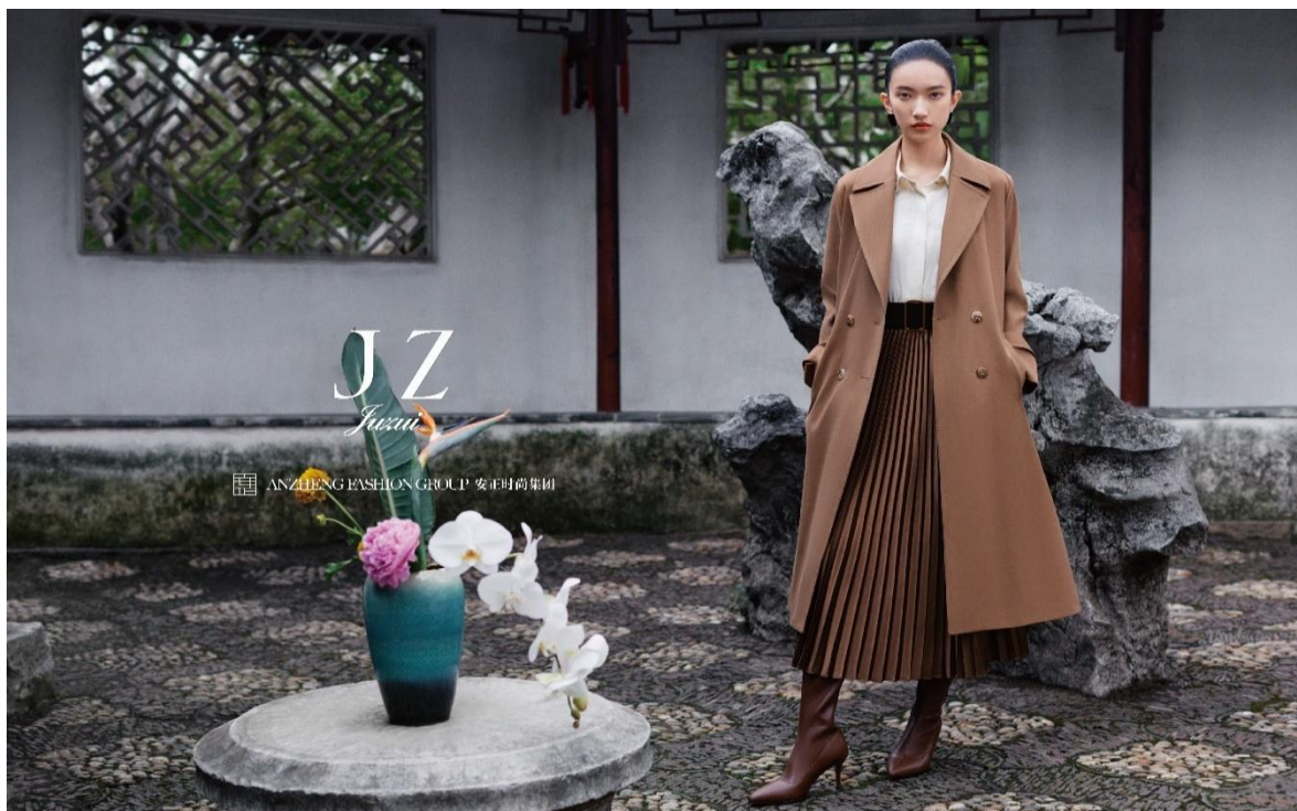
JZ 玖姿 苏州绿宝广场店