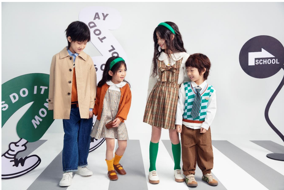
FROG PRINCE 青蛙王子 佛山市天安数码城店