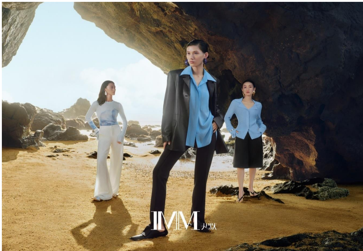
IMM 尹默 重庆北城天街店