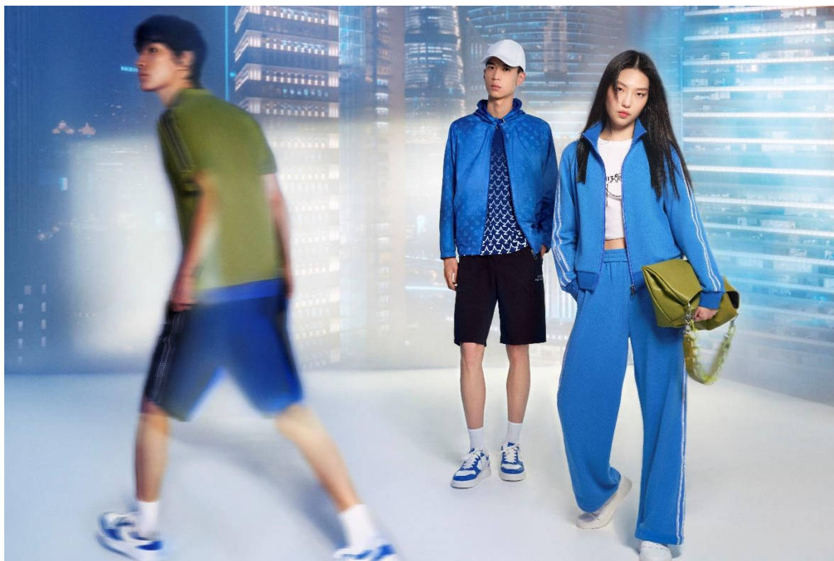
ANZHENG 安正 武汉武商 Ma11 · 国广店