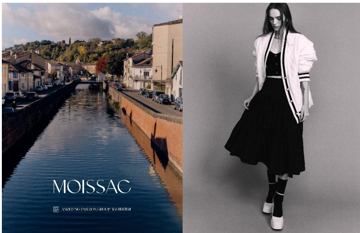
MOISSAC 摩萨克 北京朝阳大悦城店