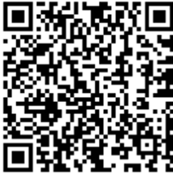
《我在乡村看见中国》专题二维码