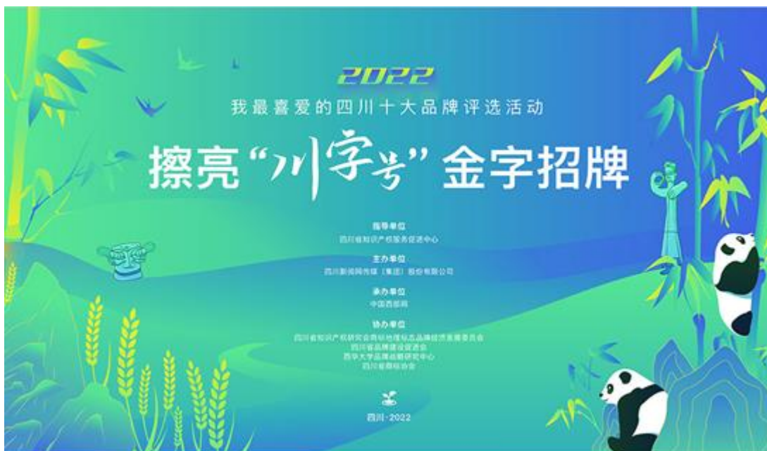
《擦亮“川字号”金字招牌评选活动》专题截图

策划擦亮“川字号”金字招牌 2022 我最喜爱的四川十大品牌”评选活动。川网传媒下属中国西部网聚焦川粮油、川猪、川茶、川菜、川酒、川竹、川果、川药、川牛羊、川鱼十大优势特色产业的四川地理标志品牌，挖掘品牌内涵，讲好品牌故事，推出《擦亮“川字号”金字招牌 2022 我最喜爱的四川十大品牌评选活动》专题 1 个，发布相关稿件 137 条，网上投票累计超 113.4 万人次，取得了较好的效果，进一步打响了“川字号”知名品牌。