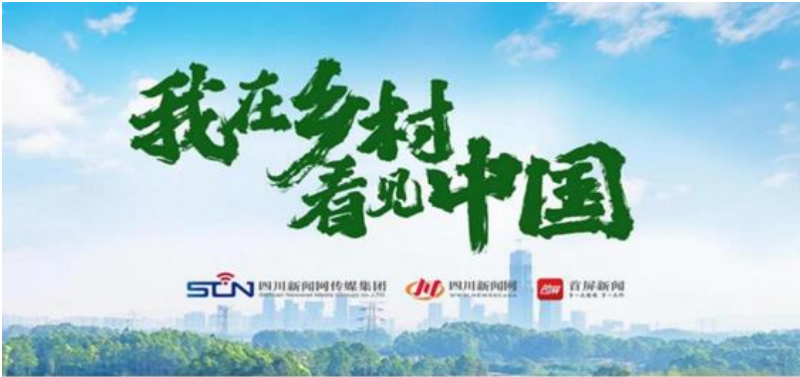
《我在乡村看见中国》专题截图