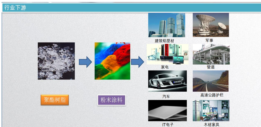
图 1-聚酯树脂下游产业链

聚酯树脂是热固性粉末涂料主要原材料之一，粉末涂料广泛应用于家电、建材、家居、农机、工程机械、5G 基站、新能源汽车、光伏发电、医疗器械、电子 3C 及一般工业等领域。粉末涂料相比普通有机液体涂料最大特点在于无溶剂性，具备环保、抗腐蚀、耐老化、装饰性优越等优点。