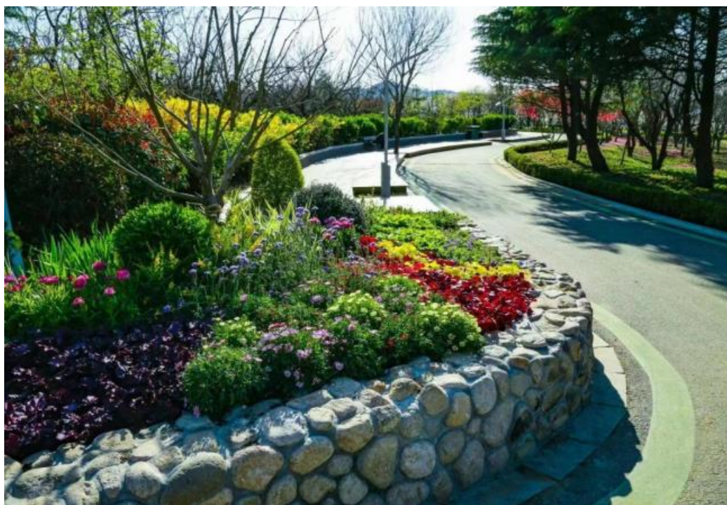
图 2：青岛市市北区浮山绿道项目完工效果

公司的人工环境生态建设业务包括景观园林、市政工程、环卫保洁等，是公司在聚焦生态修复核心业务的基础上，为增强盈利能力对业务领域的战略拓展。其中，环卫保洁业务主要是对包括市政道路、广场、河道、公厕等公共区域进行环境卫生管理，具体服务内容包括垃圾的分类、收集、清运和处置、绿化带养护、公共厕所维护，以及重大活动环卫保障等。该类型业务在公司业务中占比不大，但规模和回款相对稳定。报告期内公司实施的上述典型项目主要有 2022 年市南区公园城市建设园林绿化品质提升项目、市北区浮山防火通道（绿道）改造提升、青岛市市级公园拆墙透绿项目等等。