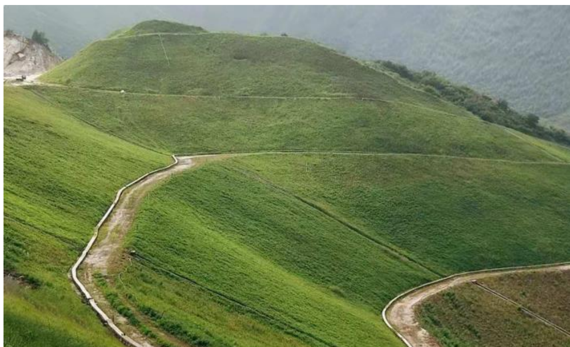
图 1：辽宁海城某矿山修复前后对比

自然环境生态修复为公司的主导业务，秉承“为环境服务”的理念，使待修复区域恢复或具备自然环境应有的生态功能和生态结构，并能持续健康演替发展。该业务依托公司独特的生态修复系列技术（如团粒喷播植被恢复技术和优粒土壤制备工艺等）展开，业务覆盖矿山生态环境治理，荒漠化、石漠化和水土流失综合治理，道路边坡等基础设施修建区生态修复，及部分海域、海岸带和海岛综合整治，河流、湖泊与湿地修复，污染场地治理等。尤其是针对土壤瘠薄或者根本没有土壤（如裸岩边坡）、水土流失问题严重、风沙大、气温低、无霜期短等立地条件特别恶劣的待修复区域，公司可以实现快速、规模化造林，且修复区域内的新建植物群落与原生植被呈现自然融为一体的效果，人工痕迹极少，解决了传统的、常规的绿化技术手段适用修复范围小和修复效果差的难题。公司近年来通过土壤改良、植物配置和工艺与装备等方面的持续创新提升，不断拓展技术应用场景，发力细分市场，形成了几大优势拳头业务即高寒高海拔区域、湿陷性黄土区域、各种岩质矿山、污染严重矿山和尾矿坝以及人工（无人）岛礁等的生态修复。报告期内，公司实施的上述典型项目主要有淄博四宝山区域生态建设综合治理项目—水体生态修复项目、乐平市废弃矿山生态修复综合治理项目（一期）、建水县历史遗留矿山生态修复项目勘察设计施工总承包、民和祁连山水泥有限公司二北沟石灰石矿矿山边坡喷播项目、东平县九女泉关停矿山生态修复总承包项目团粒喷播工程、秦岭北麓华州区矿山地质环境恢复治理工程（原华州区陕西文金栗峪矿业有限公司历史遗留矿山）施工（一标段）等。