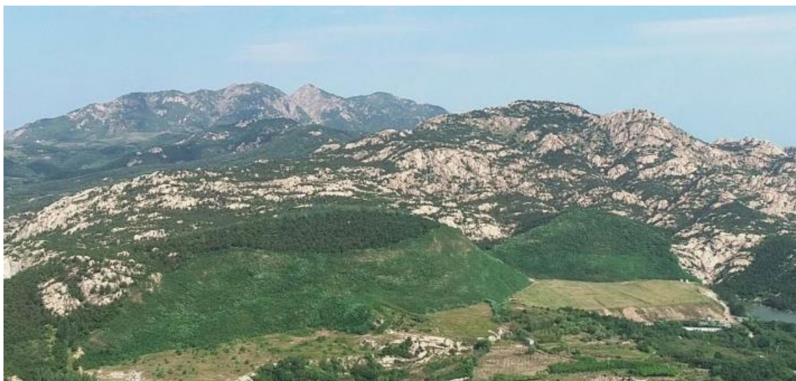
图 4：青岛西海岸新区某矿山治理前后对比