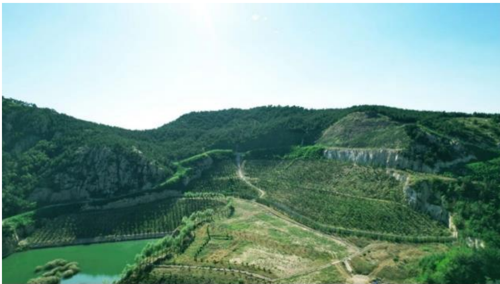
图 3：青岛市即墨区某废弃矿山修复前后对比