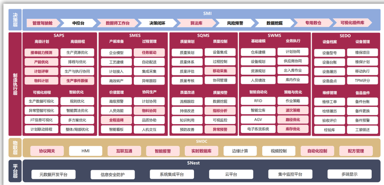
赛意信息 SMOM 智能制造产品家族概览

专业性强、成熟度高、制造运营一体化的工业管理软件产品家族（简称 S-MOM），实现了自平台层、物联层、制造执行层及数字决策层的多层次管理。解决方案以实时协同思想为主导、以动态调度为核心、以设备物联为实现手段，以制造全流程闭环管理为基础，实现制造过程透明化、制造数据可视化、制造品质可控化的工厂建设目标。