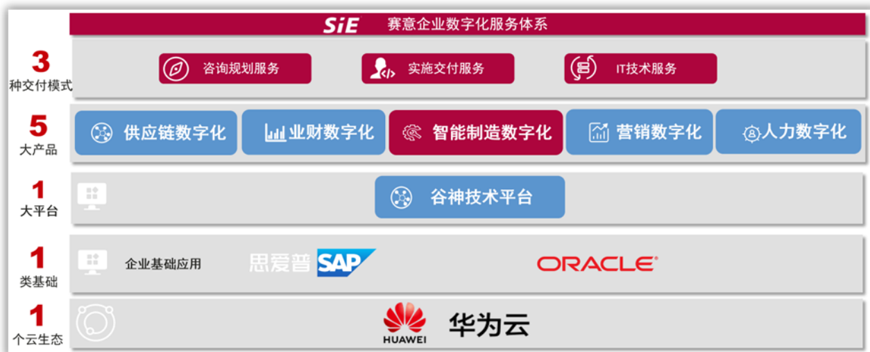
赛意信息企业数字化应用及智能制造产品体系