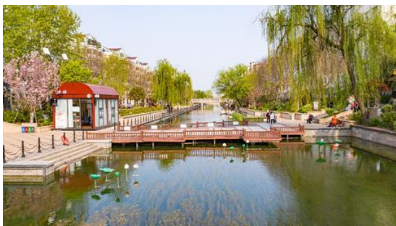
（市政项目：鹤壁市淇滨区二支渠）