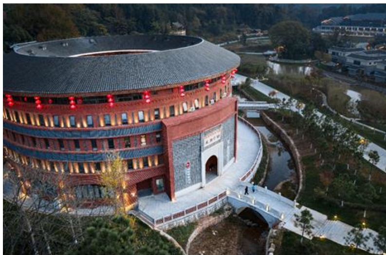
(规划设计项目：江西赣州和君教育小镇)