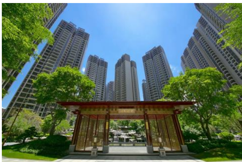
（地产项目：深圳金尊府）

对于施工总承包项目，公司实行工程项目全生命周期的成本控制。施工前，公司与客户进行沟通，了解项目的实际情况和需求，根据客户的要求和实际情况，制定施工方案和管理计划，并进行成本预测，确认计划成本。施工过程中，公司派遣专业的技术团队进行现场管理和监督，合理安排各专业施工工序，避免交叉施工产生成本浪费。项目完工后，公司及时协调客户进行竣工验收，加快推进项目进入养护期，以有效控制养护成本。同时公司采取措施加快推进结算工作，加速剩余资金回笼，保证项目现金流，减少资金成本。