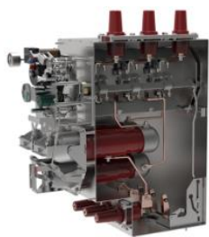
环网柜组合电器单元气箱