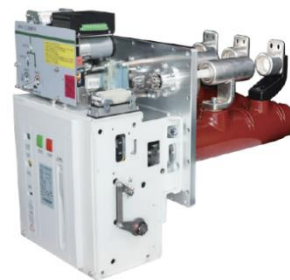
中压 C-GIS 专用真空断路器