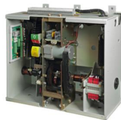
中压断路器操作机构