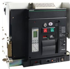
低压智能型万能式断路器