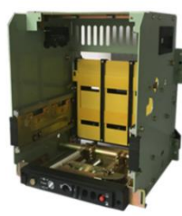
低压断路器框（抽）架