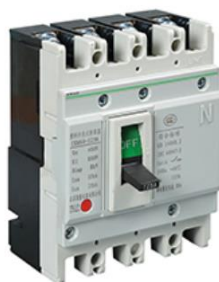
低压塑料外壳式断路器