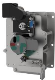
环网柜负荷开关单元操作机构