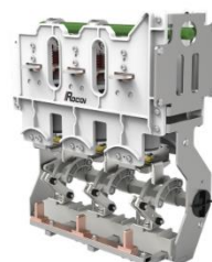
环网柜断路器单元开关