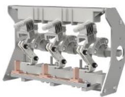
环网柜负荷开关单元开关