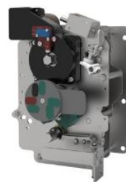
环网柜组合电器单元操作机构