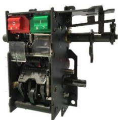
低压断路器操作机构

公司主要从事以断路器、环网柜为代表的中低压配电设备及其关键部附件的研发、生产和销售，是目前我国中低压配电设备及关键部附件行业中研发、生产、服务能力位于前列的企业之一。公司产品主要用于电力系统的配电设施，包括低压及中低压断路器配套用框（抽）架、操作机构、附件和智能环网柜及智能环网柜的断路器单元操作机构及开关、负荷开关单元操作机构及开关、组合电器单元操作机构及开关等。