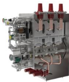
环网柜断路器单元气箱