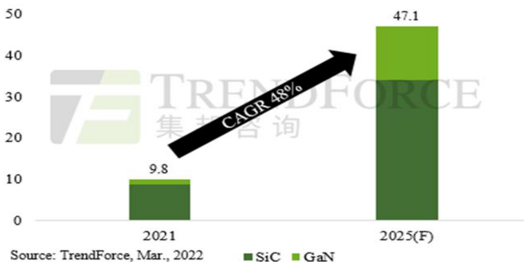
图、2021~2025年第三代功率半导体市场规模预估（单位：亿美元）

IGBT 行业的快速发展将会快速提升气体材料的应用，对于可供应和已供应的公司来说，市场空间大。