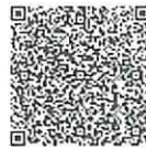
范震杰年检二维码

本证书经检验合格，继续有效一年。 This certificate is valid for another year after this renewal.