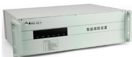
AEI-T1 型 5T 智能跟踪装置