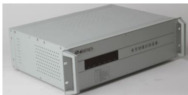
AEI-W1 型车号地面识别设备