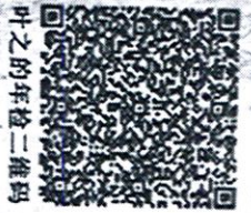
叶之的年检二维码

证书编号: 310000062055 No. of Certificate 批准注册协会: 上海市注册会计师协会 Authorized Institute of CPAs 发证日期: 2019年 07月 15日 Date of Issuance