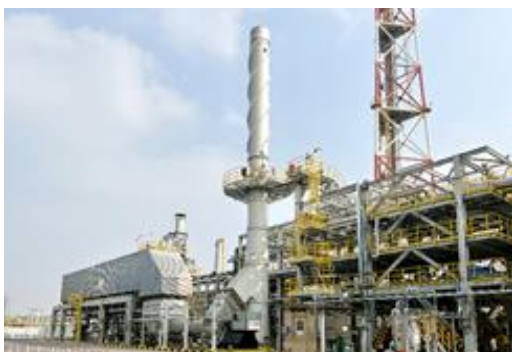
中央废气处理及能量回收项目

报告期内，扬子石化-巴斯夫有限责任公司中央废气处理及能量回收项目在南京正式投料成功。该项目是国内乃至国际同行业最为领先的集中式废气处理项目之一，依托于亚德公司先进的危废处置技术和工艺安全设计，将一体化基地各装置的二十多股废气集中收集、无害化处理后进行能源回收，并针对复杂工况，同步开展脱硝和挥发性有机气体 (VOC) 治理，实现了节能、减排和降碳的协同处理。项目投用后，全年可产生 27 万吨蒸汽，回收的能量用于一体化基地生产，将减少 576 万标立的天然气消耗，进一步减少扬子石化-巴斯夫的碳足迹。