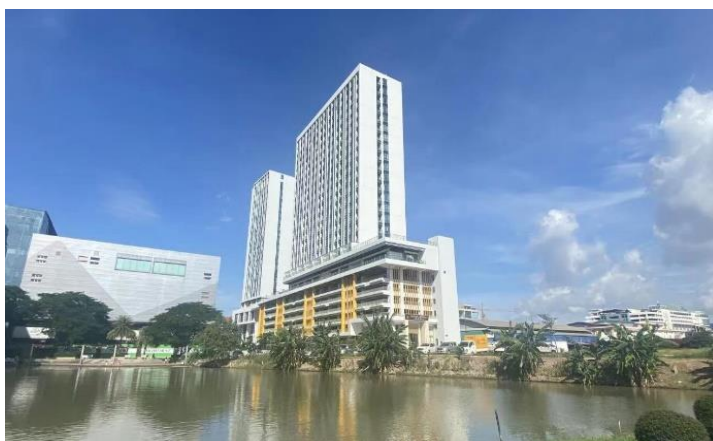
老挝万象生活中心项目