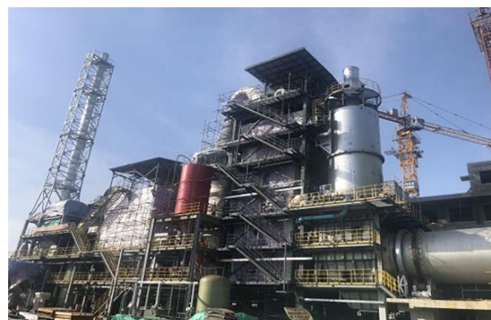
海南洋浦港危险废物处理中心项目