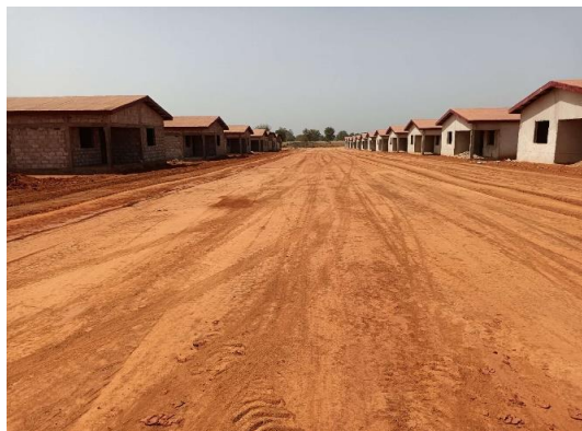
科特迪瓦旱港建设项目