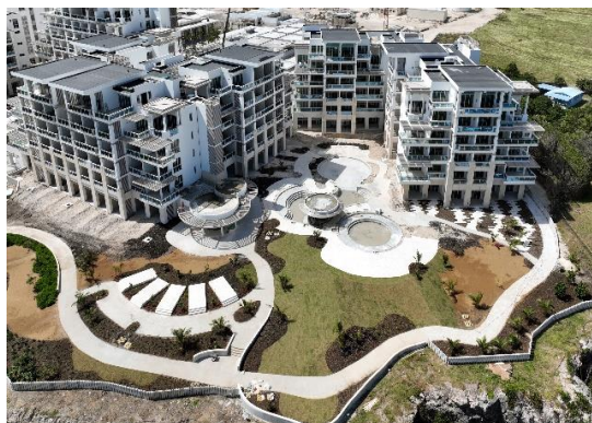
巴巴多斯山姆罗德酒店项目