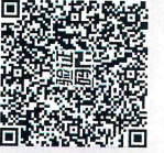
违规担保及解除情况表