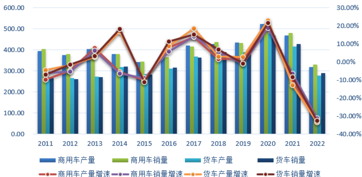
图1 2011年-2022年我国商用车、货车产销量及增速 单位：万辆

2018 年，各地区各部门认真贯彻落实党中央国务院决策部署，按照推动高质量发展要求，深入推进供给侧结构性改革，积极落实稳就业、稳金融、稳外贸、稳投资政策，经济运行在合理区间，继续保持总体平稳、稳中有进发展态势。全年共产销商用车 427.98 万辆和 437.08 万辆，同比增长 1.69% 和 5.05%。