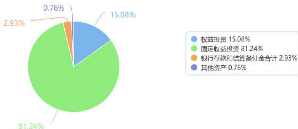
投资组合资产配置图表（数据截至日期：2022年09月30日）