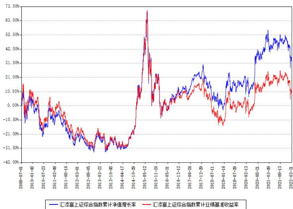
汇添富上证综合指数累计净值增长率与同期业绩基准收益率对比图

(二) 自基金合同生效以来基金累计净值增长率变动及其与同期业绩比较基准收益率变动的比较图