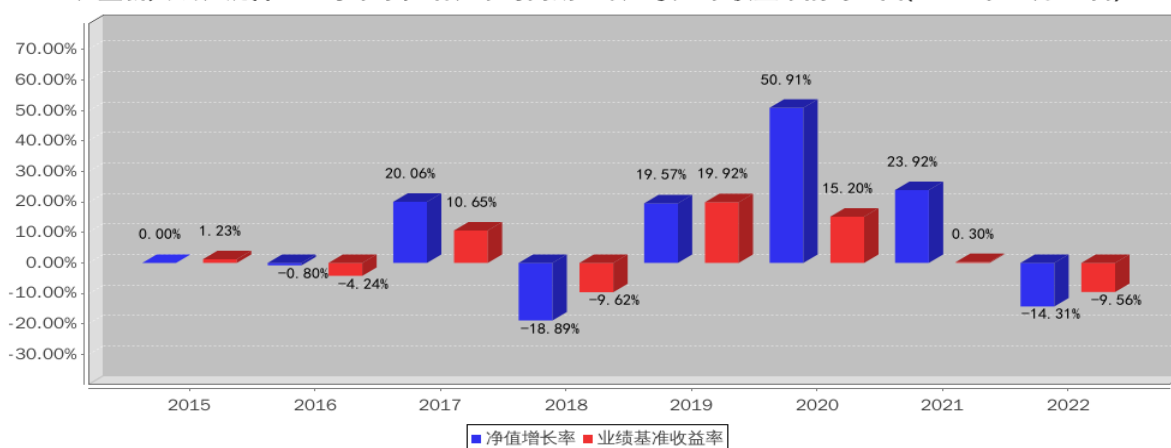
长盛新兴成长混合基金每年净值增长率与同期业绩比较基准收益率的对比图(2022年12月31日)