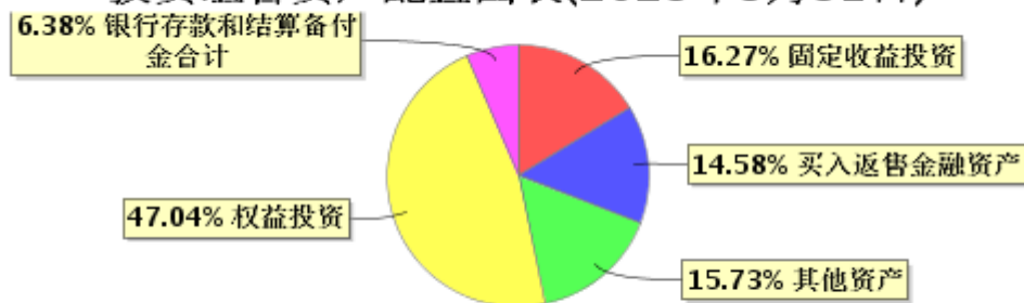
投资组合资产配置图表(2023年3月31日)

● 固定收益投资 ● 买入返售金融资产 ● 其他资产 ● 权益投资 ● 银行存款和结算备付金合计