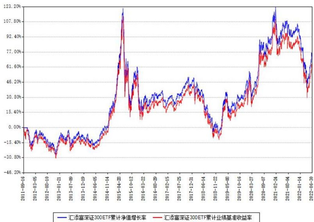
汇添富深证300ETF累计净值增长率与同期业绩基准收益率对比图