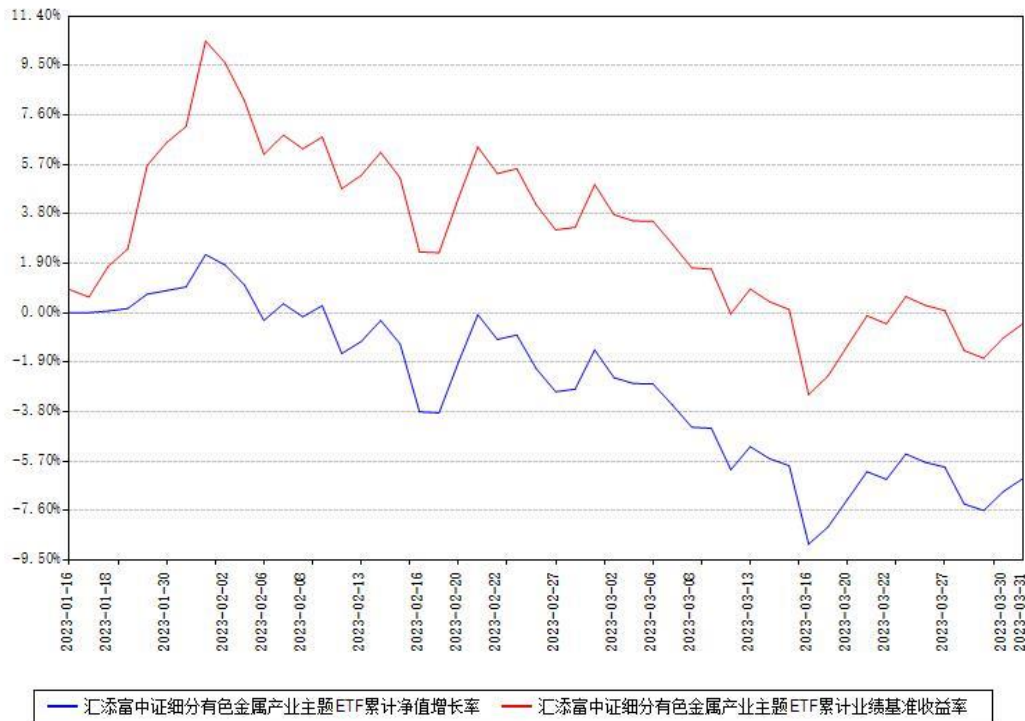
汇添富中证细分有色金属产业主题ETF累计净值增长率与同期业绩基准收益率对比图