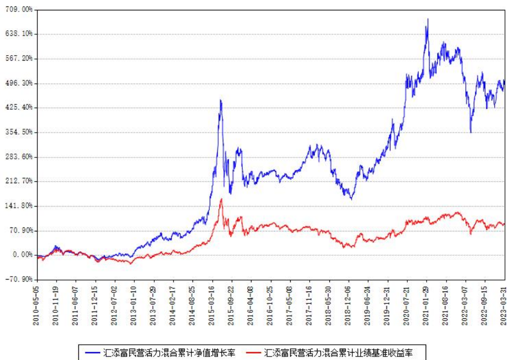
汇添富民营活力混合累计净值增长率与同期业绩基准收益率对比图