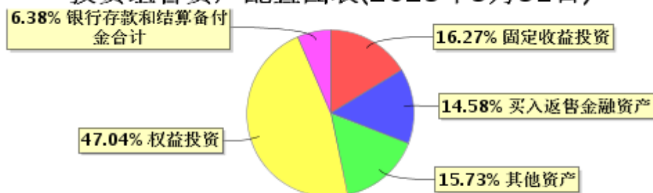
投资组合资产配置图表(2023年3月31日)

● 固定收益投资 ● 买入返售金融资产 ● 其他资产 ● 权益投资 ● 银行存款和结算备付金合计