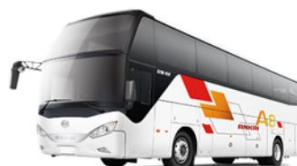
HFF6120K09D1E6 外型(mm):12000×2550×3690 座位数: 49+1 (24-56)