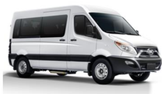
HFF6530Q5EV21 外型(mm):5300×2080×2395 座位数: 10--11

一款长头轻型纯电动商务客车，车辆长度 5.3 米，续驶里程 300km，可满足特定市场的差异化需求；纯电动 K8 系列是公司全新打造的纯电动客车平台，专门用作城乡客运业务，车辆长度 5.99 米；纯电动 K7 系列是公司倾力打造的具有完全自主知识产权的高档商务旅游客车，车辆长度 7 米，适合中高端旅游接待；纯电动 A6 系列采用全新造型设计，整体时尚简约、美观大气，微笑式前脸，车辆长度具有 8.2 米、10.99 米和 11.3 米等多种配置，适合团体通勤、旅游、客运等多种用途；纯电动 A8 系列，整车外型亲和、稳重、协调、流畅，适合团体通勤、旅游、客运等多种用途。