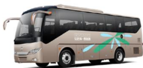
HFF6829A6EV21 外型(mm):8245×2500×3430,3290 座位数: 31+1 (24-32) 带中门, 33+1 (24-36) 无中门, 有安全门