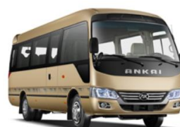
HFF6710BEV 外型(mm):7145×2040×2725,2785 座位数: (19+1) 10-20