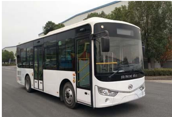
全承载式城市公交客车

城乡公交客车系列定位于广大农村乡镇市场，该系列车型强度高，适合各种复杂路面行驶，具有较好的通过性。长度覆盖 6-7.3 米等多个车型，配有多款动力配置以及中后开门、中开门等多样化定制方案设计供客户个性化选择。