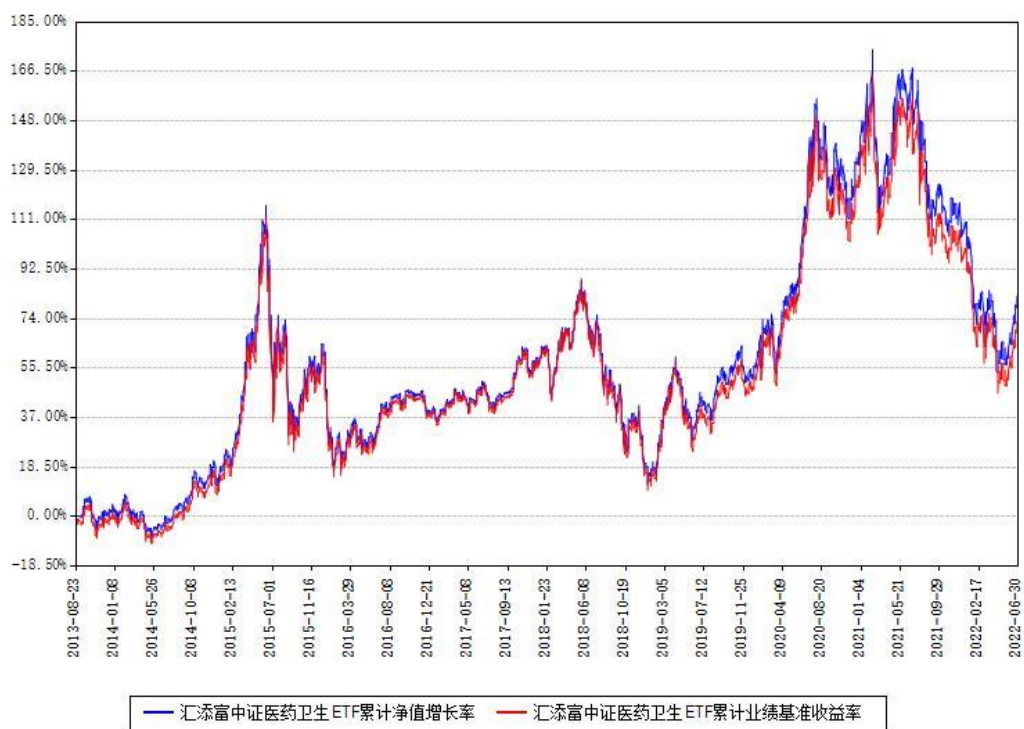
汇添富中证医药卫生ETF累计净值增长率与同期业绩基准收益率对比图