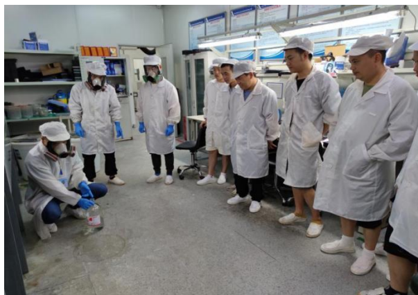
图：危险化学品(危险废物)泄露应急演练

公司结合实际情况修订了《生产安全事故应急预案》，其中包含综合应急预案、5项专项应急预案、7项现场处置方案，并按程序报省国防科工局军工处备案；按要求编制了公司《突发环境事件应急预案》，按程序报市环境应急中心备案；及时补充更新和完善应急物资，加强应急物资储备管理并积极组织开展应急预案演练工作。2022年，公司开展消防演练2次，危险化学品（危险废物）泄露应急演练1次，累计301人次参加。