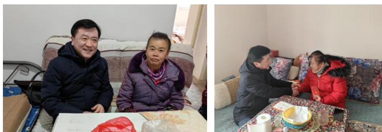
图：公司组织到员工家进行走访