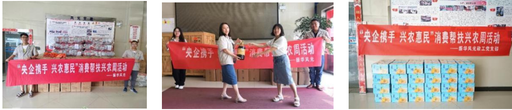
图：央企携手兴农惠民活动