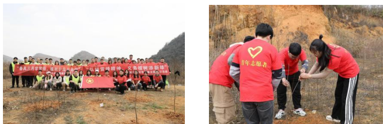
图：公司组织植树节活动