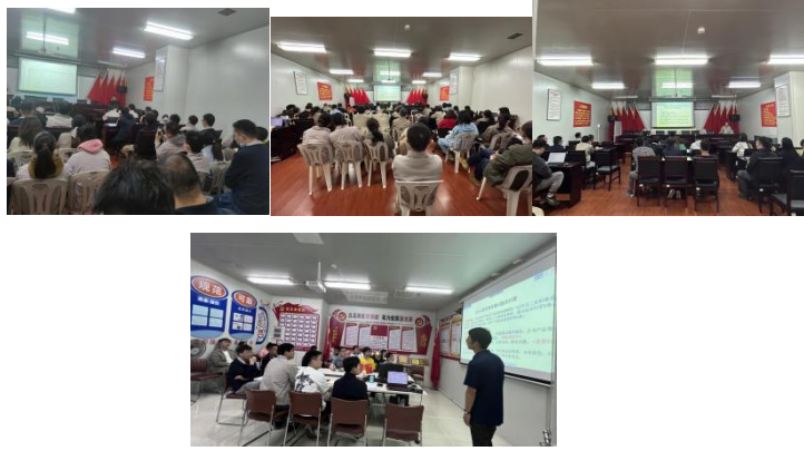
图：组织员工参加培训