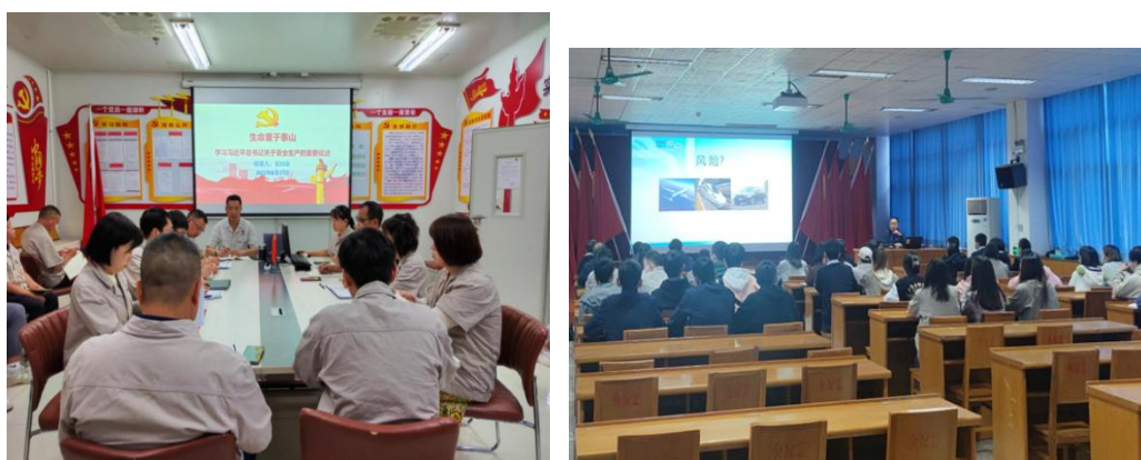
图：安全培训宣传活动

【案例】公司认真落实《生产经营单位安全培训管理规定》及相关工作要求，以“安全生产月”“防灾减灾日”“消防宣传日”等为契机，积极组织开展各项安全培训宣传活动。同时，公司通过张贴安全、消防、环保海报、横幅等多种形式大力开展安全宣传活动，营造了良好的安全生产氛围，促进了全员安全生产防范意识的有效提升，牢固树立培训不到位就是重大安全隐患的理念。