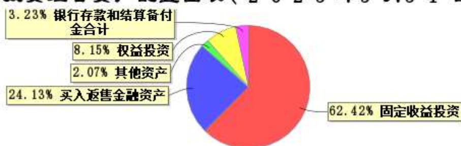
投资组合资产配置图表(2023年3月31日)

● 固定收益投资 ● 买入返售金融资产 ● 其他资产 ● 权益投资 ● 银行存款和结算备付金合计