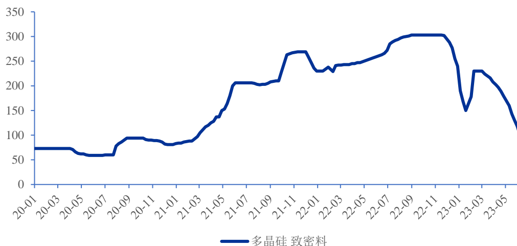
多晶硅价格（单位：元/千克）

发行人的原材料主要是多晶硅料，上游供应商的供应量和供应价格将影响发行人的成本水平和排产计划，进而影响发行人主要产品硅片价格及发行人的盈利能力。