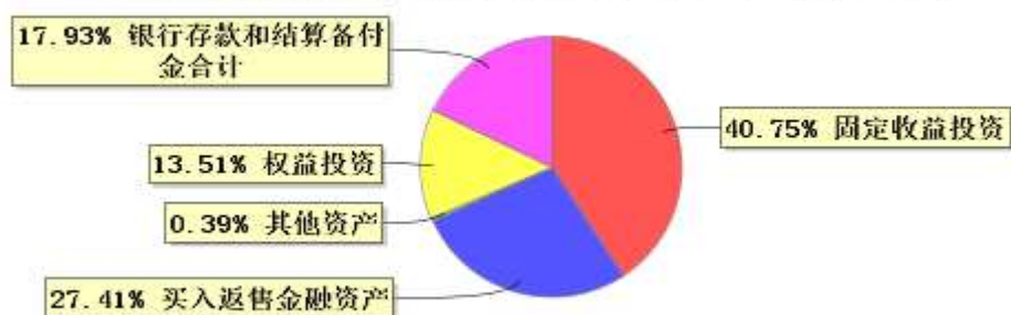
投资组合资产配置图表(2023年3月31日)

● 固定收益投资 ● 买入返售金融资产 ● 其他资产 ● 权益投资 ● 银行存款和结算备付金合计