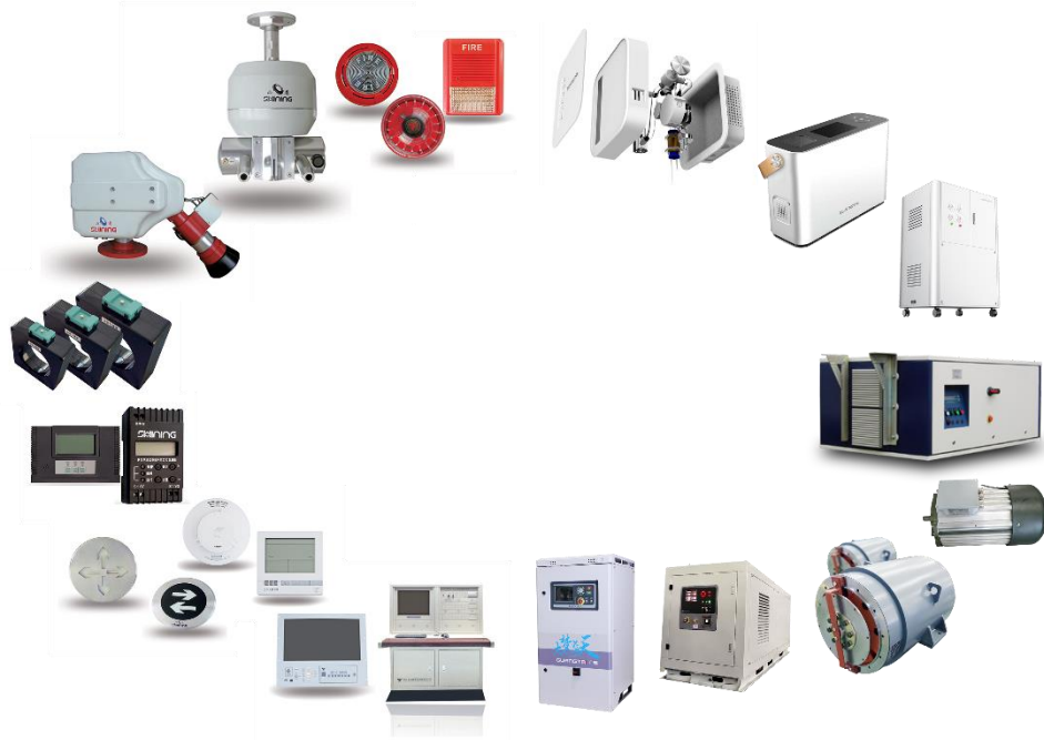
电力电子装备示意图

电力电子板块由消防报警设备、电源、电机、制氧设备业务组成，其中消防报警设备是该板块核心业务。消防报警设备依托于全资子公司山鹰报警，主要产品有二线制火灾控制报警系统、智能应急照明和疏散指示系统等，现有产品包含9个系类211种型号。电源、电机业务主要用于配套公司空港装备电动化、零部件销售和整车销售，可显著降低配套产品成本，提高产品质量，同时也作为零部件和产品对外销售。制氧设备作为医疗板块重要协同，可应用于移动医疗车辆和大空间供氧，配合公司医疗板块战略布局。