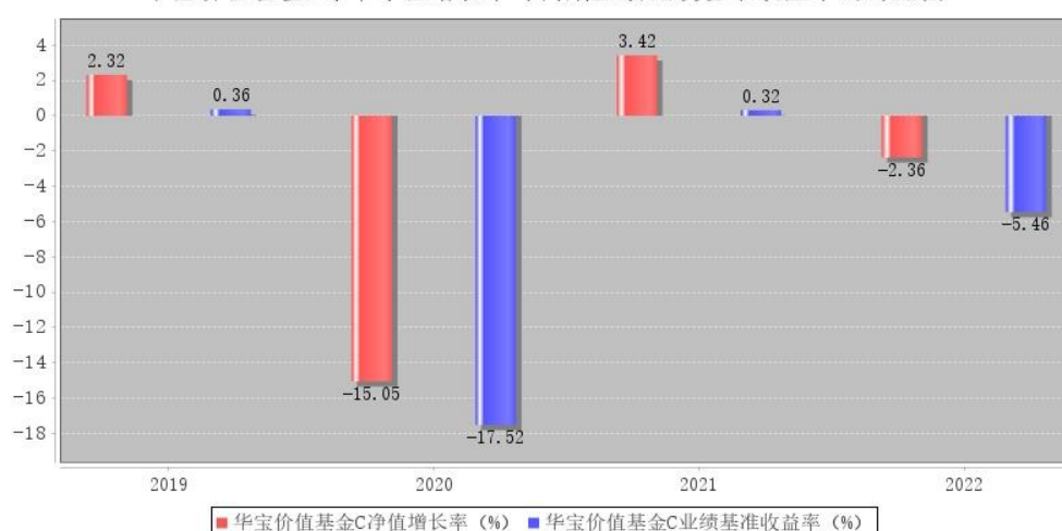
华宝价值基金C每年净值增长率与同期业绩比较基准收益率的对比图