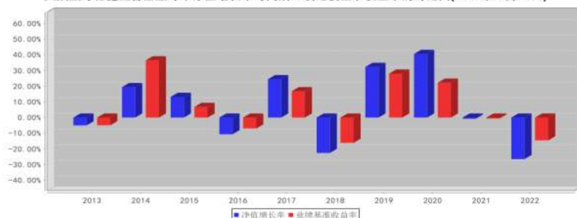
大成蓝筹稳健混合基金每年净值增长率与同期业绩比较基准收益率的对比图(2022年12月31日)