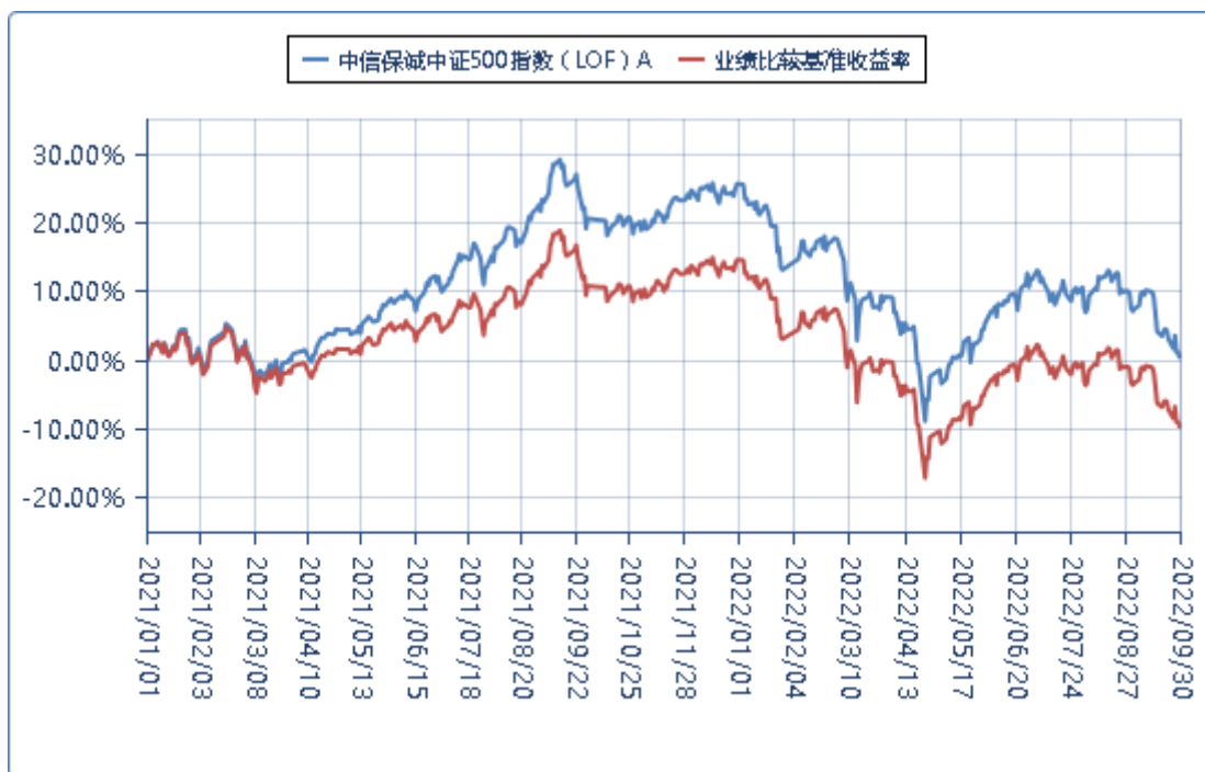
中信保诚中证 500 指数 (LOF) C